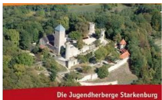
Die Jugendherberge Starkenburg

Es stehen uns überwiegend 6 bis 8 Bett-Zimmer zur Verfügung, die wir wenn möglich nur mit max. 4 bis 5 Personen belegen wollen. Doppel- und Einzelzimmer sind leider nicht möglich.